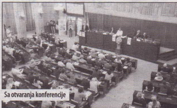
Sa otvaranja konferencije

„Ono što je posebna vrednost ovog projekta jesu demo plastenici sa savremenim mernim instrumentima. Oni će biti smešteni na Institutu, ali i na još tri lokacije širom Vojvodine - srednjim poljoprivrednim školama u Futogu, Rumi i Vršcu. Namera nam je da na ovaj način motivišimo i edukujemo mlade poljoprivredne proizvođače da se ba-