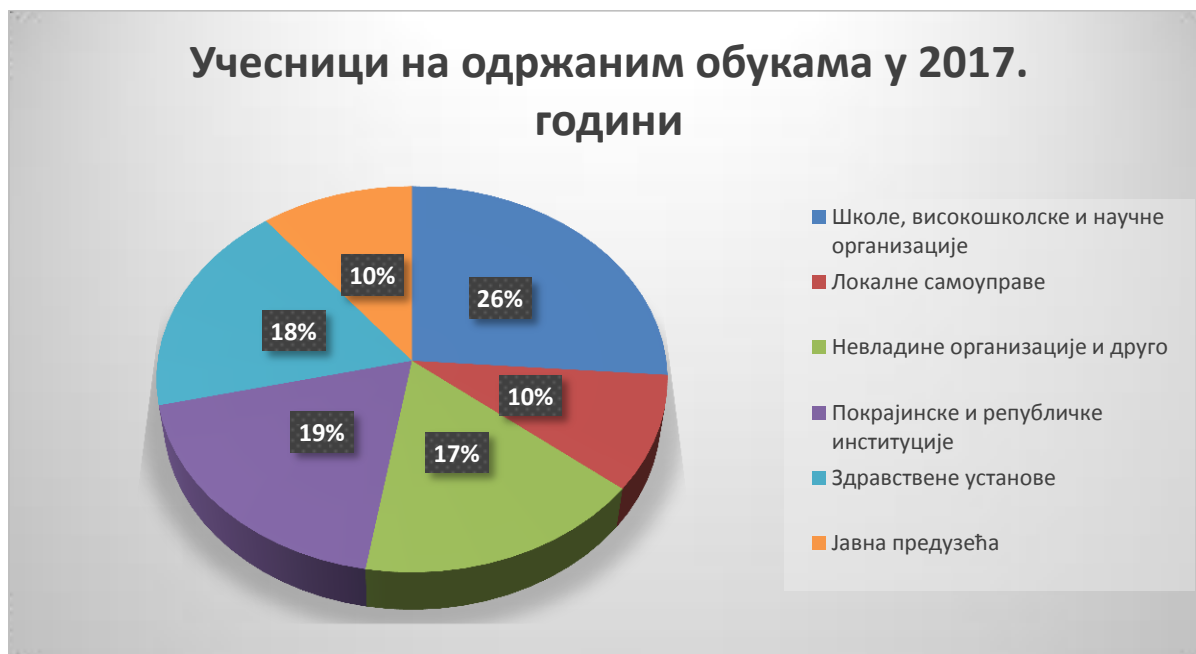
Графикон 1. – Преглед учесника на обукама по врстама институција из којих долазе за 2017. годину

Едукативне активности на тему припреме и реализације европских пројеката спровођене су током целе године. Структура учесника на обукама, на основу врсте институција које су поднеле захтев за одржавање обуке, приказана је на Графику бр. 1. Највећи број полазника, 26%, представници су образовних институција, али и представници научно-истраживачких центара и факултета. Представници институција које су основане од стране Републике Србије и АП Војводине чине 19% од укупног броја полазника, локалне самоуправе 10%, јавна предузећа 10%. Из здравствених институција је обуку похађало 18% полазника, а 17% чине представници невладиних организација и других видова удружења.