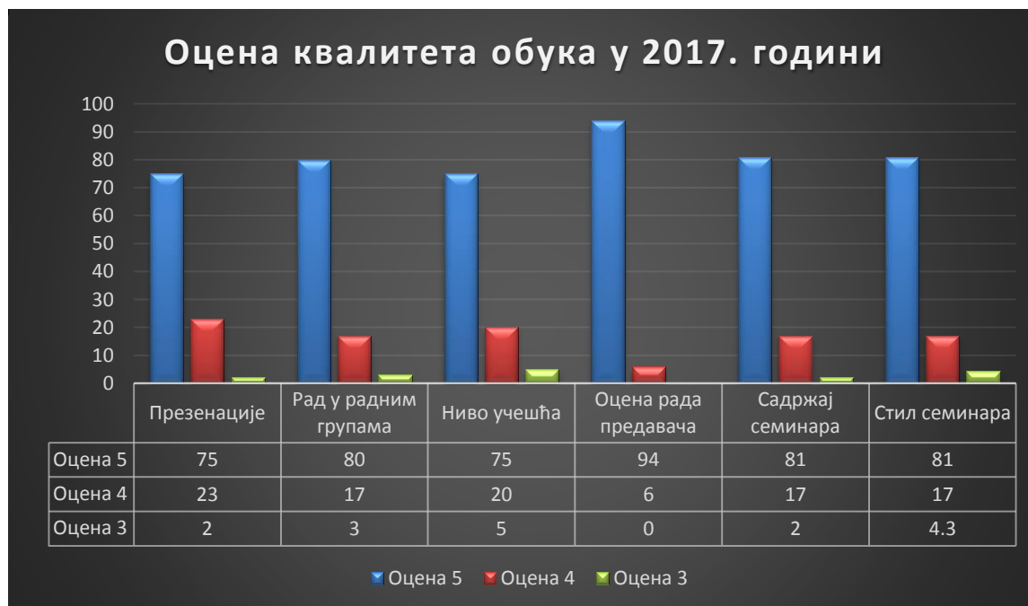
Графикон 3. – Испуњеност очекивања полазника након реализације обука