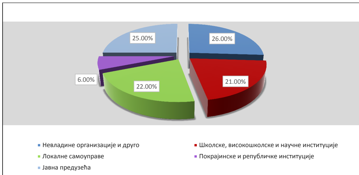
Графикон 5. - Структура учесника у оквиру активности "Процена пројектних идеја" током 2017. године