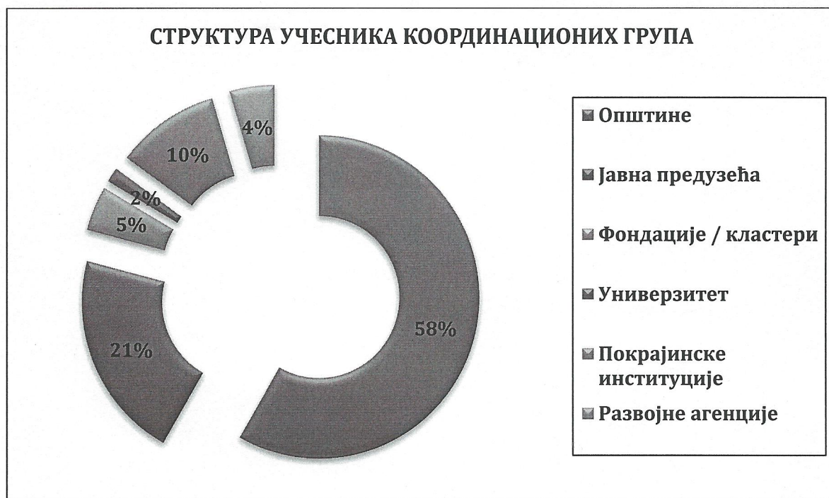
График 1. – Структура учесника координационих група формираних током 2012. године

Циљеви координационих група у претходном периоду су били: