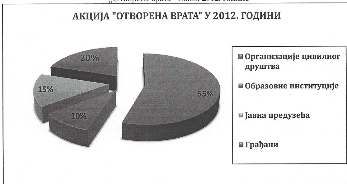
График 2. – Структура учесника на консултацијама у оквиру акције „Отворена врата“ током 2012. године

Такође, Фонд је пружао стручну помоћ приликом регистрације у ЕУ бази за потенцијалне кориснике и пројектне партнере - ПАДОР, као и консултације у вези са могућим проблемима који се могу јавити приликом регистрације.