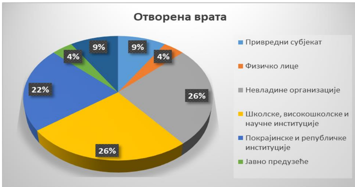
Графикон 4. – Структура учесника на консултацијама у оквиру акције „Отворена врата“ током 2019. године