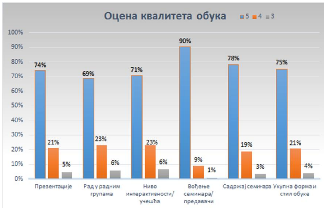
Графикон 3. – Испуњеност очекивања полазника након реализације обука

83 % полазника је након реализације обука изјавило да је семинар испунио њихова очекивања што је приказано Графиконом бр. 3.