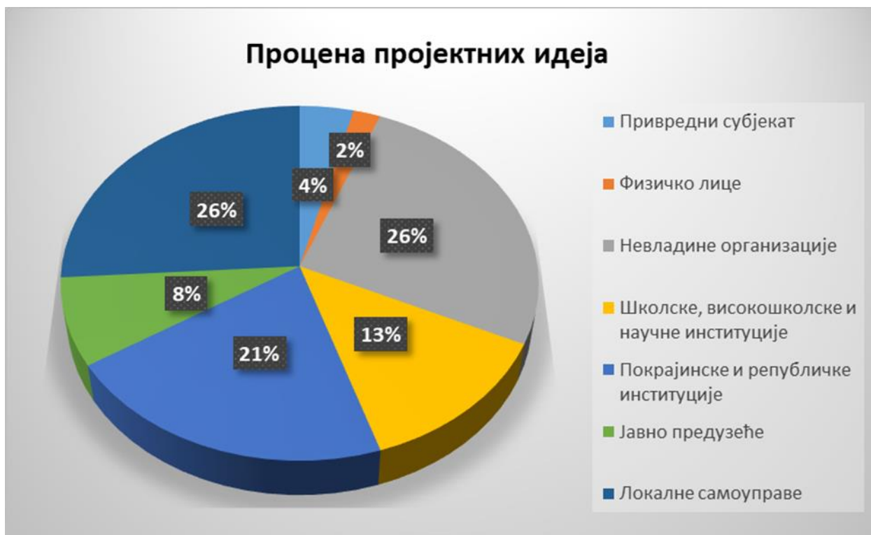
Графикон 5. - Структура учесника у оквиру активности "Процена пројектних идеја" током 2019. године