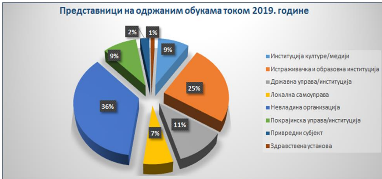
Графикон 1. – Преглед учесника на обукама по врстама институција из којих долазе за 2019. Годину

Едукативне активности на тему припреме и реализације европских пројеката спровођене су током целе године. Структура учесника на обукама, на основу врсте институција које су поднеле захтев за одржавање обуке, приказана је на Графикону бр. 1. Највећи број полазника, 36%, представници су невладиних организација, 25% су представници научно-истраживачких центара и школа. Представници институција које су основане од стране Републике Србије и АП Војводине чине 20% (9% покрајинска управа/институције и 11% државна управа/институције) од укупног броја полазника, локалне самоуправе 7%, док 9% чине представници институција културе и медија.