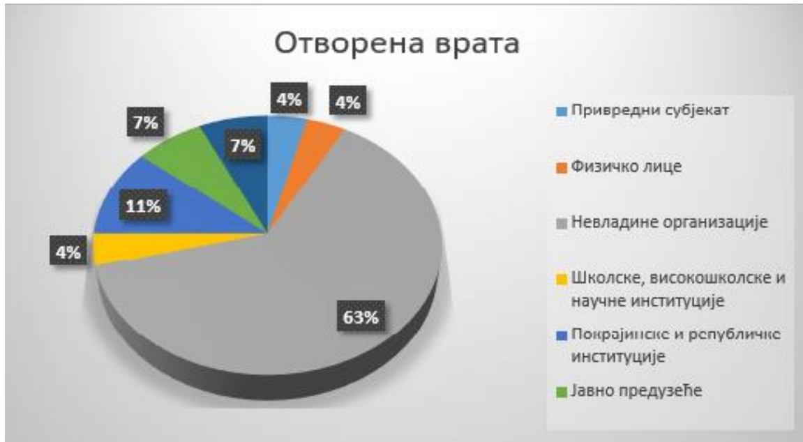
Графикон 4. – Структура учесника на консултацијама у оквиру акције „Отворена врата“ током 2020. године