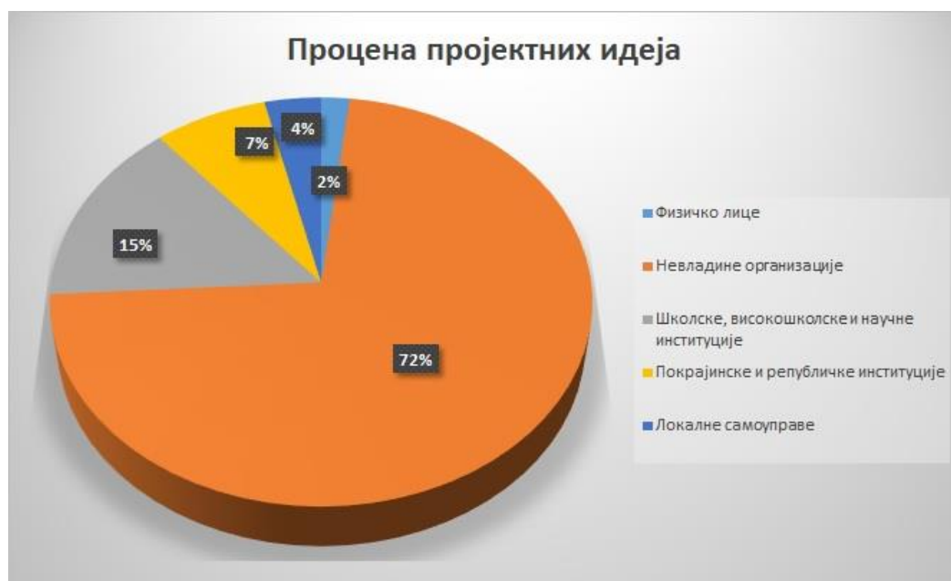
Графикон 5. - Структура учесника у оквиру активности "Процена пројектних идеја" током 2020. године