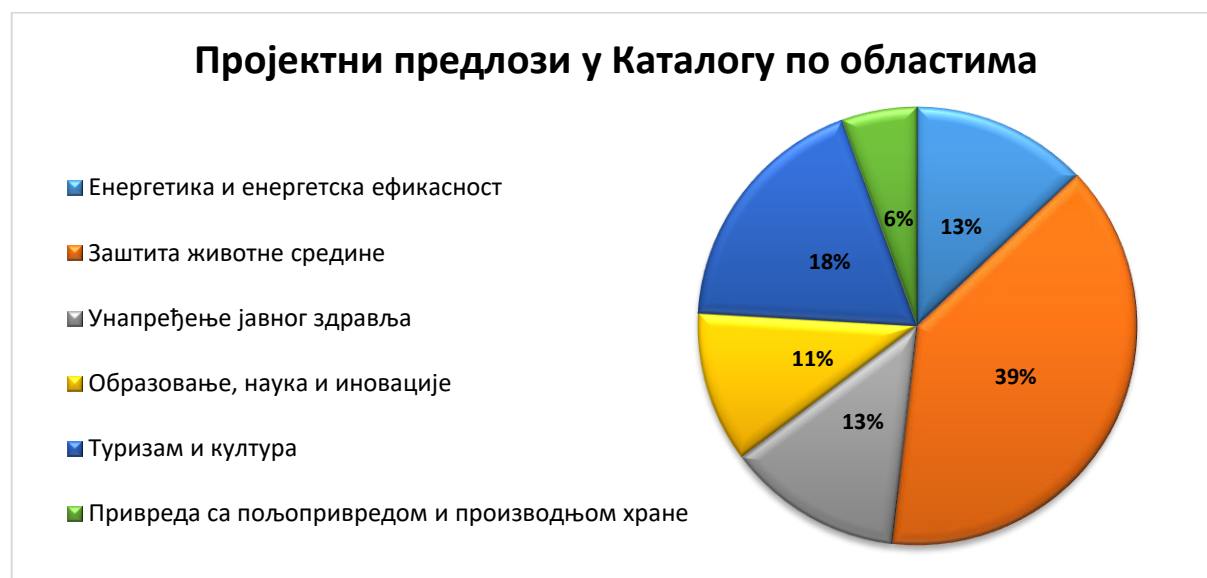
Графикон 5 - Структура пројектних предлога у оквиру активности "Анализа пројектних предлога-Каталог пројеката" током 2022. године

Каталог пројектних идеја прати области које је дефинисала Европска унија у својим стратешким документима и програмима као области за финансијску подршку. Пројектне идеје, у Каталогу, разврстане су по следећим областима: енергетика и енергетска ефикасност; заштита животне средине; унапређење јавног здравља; образовање, наука и иновације; туризам и култура; као и привреда са пољопривредом и производњом хране. У оквиру сваке области, пројектне идеје представљене су по редоследу процењене вредности – од пројектних идеја мале вредности ка пројектним идејама велике вредности са инвестиционим компонентама.