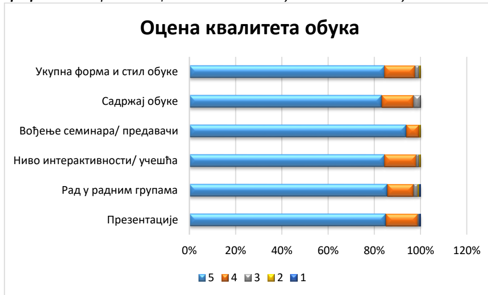
Графикон 2 - Преглед оцене квалитета обука за 2022. годину

Утврђено је да је концепт обука у потпуности испунио очекивања учесника и да 91% полазника сматра да је обука у потпуности испунила њихова очекивања што је приказано Графиконом бр.6., док њих 9% сматра да је обука углавном испунила њихова очекивања.